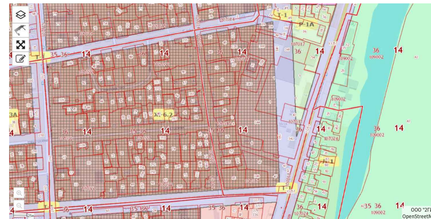
Ж-6.2. Застройка многоэтажными жилыми домами 9 этажей и выше (Якутск)